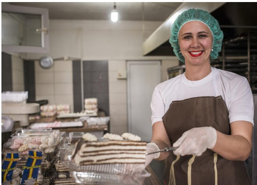
Foto: Kundin von Mikrofin in ihrer Bäckerei

Mikrofin in Bosnien-Herzegowina wurde 1997 gegründet und ist bereits seit Auflegung des Fonds 2015 eines unserer Partnerinstitute. Sowohl über das Mikrofinanzinstitut selbst, als auch über das Schwester-Unternehmen MF Banka bieten die beiden Firmen ihren Kund*innen Finanzdienstleistungen mit hohen sozialen und ökologischen Standards, u.a. im Bereich der Erneuerbaren Energien.