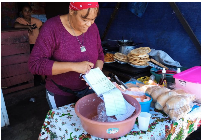
Foto: Kundin von IDH, aufgenommen im Zuge der Kreditprüfung vor Ort durch unseren Investment Manager Gerardo Tavalera

Die Mikrofinanz-Organisation IDH ist seit rund 45 Jahren vor Ort tätig und bietet sowohl Individual- als auch Gruppenkredite an. In den ländlichen Gebieten werden u.a. Kredite zum Betreiben von Solaranlagen oder auch Wasserspeichertanks angeboten. Das Institut zeigt ein hohes Maß an Sensitivität und Verantwortung bei seinem Ziel, dass Leben seiner Kund*innen in wirtschaftlicher und sozialer Hinsicht zu verbessern.