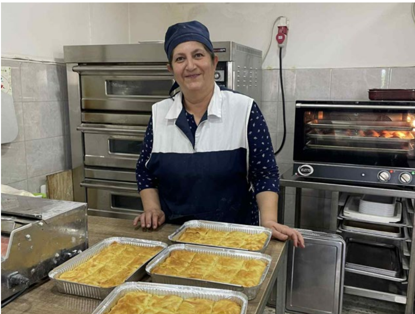
Kundin von Karmuj in ihrer Backstube

Die „Karmuj“ Universal Credit Organization CJSC ist ein in Armenien lizenziertes Mikrofinanzinstitut, welches Geschäftskredite, Agrarkredite sowie Kredite für Wohnungsrenovierungen und -modernisierungen anbietet. Seine soziale Mission unterscheidet das Institut von anderen Mikrofinanzanbietern, welche sich i.d.R. stärker auf Profit und Wachstum ausrichten. Karmuj ist eines der wenigen Institute, die das GLS Positivkriterium von mehr als 10 % sog. Grüner Kredite erfüllt.