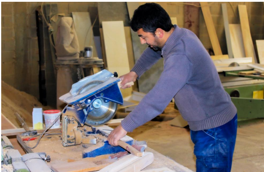
Kunde von AFK in seiner Werkstatt

Agjencioni per Financim ne Kosove (AFK Kosovo) ist seit 2017 Kunde des GLS AI Mikrofinanzfonds und zeichnet sich im Kosovo dadurch aus, dass es vor allem die Lücke zwischen traditionellen Mikrofinanzinstitutionen und Geschäftsbanken schließt. Daher ist es auch eines der professionellsten Unternehmen innerhalb seines Sektors. Im Fokus stehen dabei insbesondere ein institutionelles Risikomanagement sowie klare Unternehmensstrukturen und Verantwortlichkeiten – bei gleichzeitiger Betonung der sozialen Mission und Ausrichtung auf die Bedürfnisse der Kund*innen.