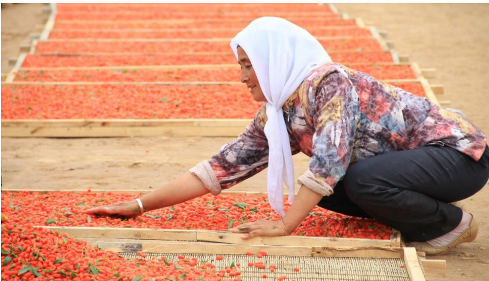
Kundin von Huimin beim Trocknen von Beeren

Das Mikrofinanzinstitut Huimin (Ningxia Dongfang Huimin Microfinance Ltd.) ist in ländlichen Bereich in Zentralchina engagiert und richtet sich dort vorrangig auf Mikro-Unternehmerinnen aus, mehr als 80% des Kundenbestands sind Frauen. Das durchschnittliche Einkommen liegt um Faktor (!) 3 bis 4 unterhalb der reicheren Landesteile, die Bevölkerungsstruktur ist vergleichsweise heterogen und auf Landwirtschaft ausgerichtet. Das Institut hat ein klares Mandat für finanzielle Inklusion und bedient daher auch Kunden, an denen rein kommerzielle Kreditgeber kaum Interesse zeigen.