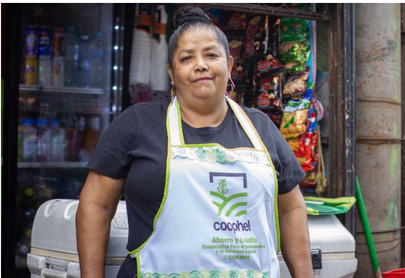
Kunden von Microinvest in ihrem Laden

Das Mikrofinanzinstitut (MFI) COOPHEL aus El wurde 1990 gegründet, um einkommensschwache Bevölkerungsgruppen zu unterstützen – darunter durch den Bürgerkrieg vertriebene Menschen sowie schutzbedürftige Kleinstunternehmer. Die Institution verfolgt einen konsequent entwicklungspolitischen Auftrag, der auf finanzielle Inklusion und Armutsbekämpfung ausgerichtet ist. Tatsächlich hebt sich die Institution von vielen anderen Mikrofinanzinstituten (MFIs) in El Salvador ab: Sie kombiniert Finanzdienstleistungen mit Programmen zur sozialen Entwicklung, legt einen großen Schwerpunkt auf Frauen und einkommensschwache Mikrounternehmer*innen und kann als Genossenschaft Kredite als auch Sparprodukte anbieten.